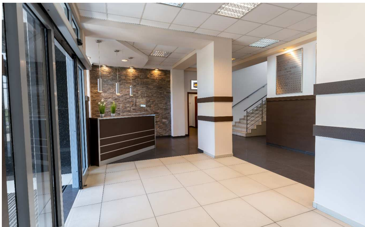
Hol główny i piętro